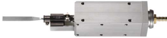
pilnikarka PLV 01