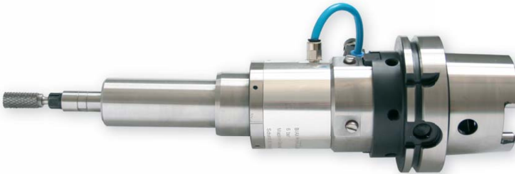
wrzeciono (również do robotów) z progresywnym dociskiem i stożkiem HSK