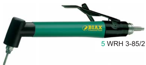
5 WRH 3-85/2