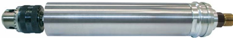
wrzeciono wiertarskie RB 4102 (1.700 obr/min)