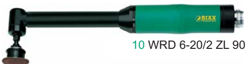
10 WRD 6-20/2 ZL 90