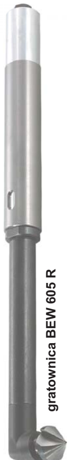
gratownica BEW 605 R