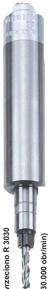
wrzeciono R 3030