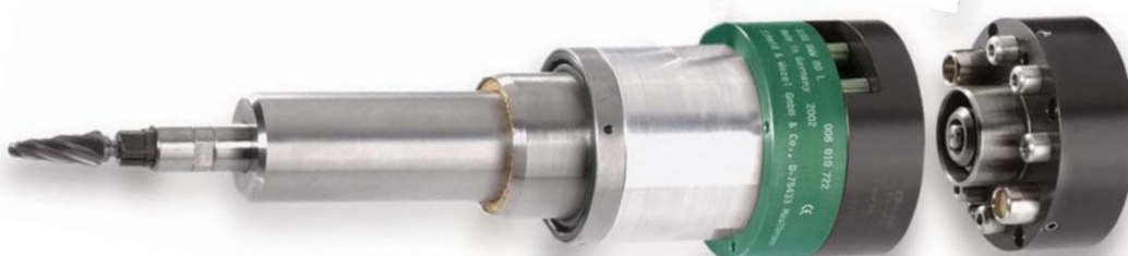
wrzeciono BWSO 2-22 z szybkim mocowaniem, do robotów