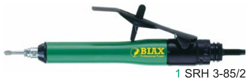
1 SRH 3-85/2