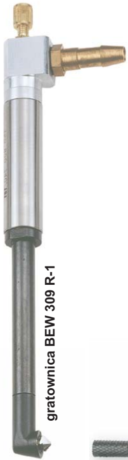
gratownica BEW 309 R-1