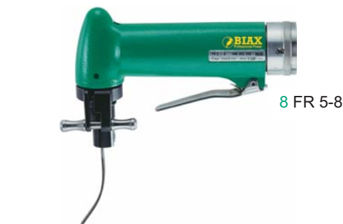
8 FR 5-8